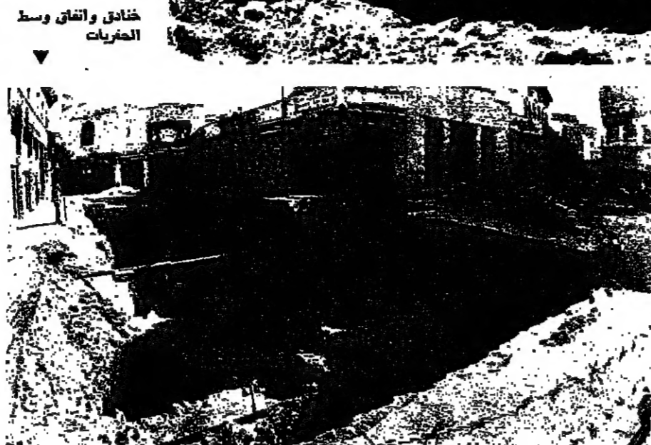
خنادق وفتق وسط الحفريات